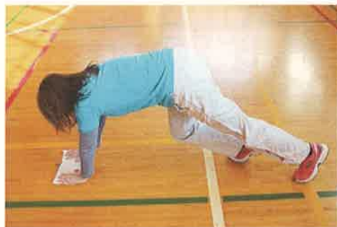
ぞうきんがけ・ぞうきんがけリレー

おにごっこ じんとり けいどろ 増やしおに 固定遊具サーキット ジャンケン当てゲーム しっぽとりゲーム