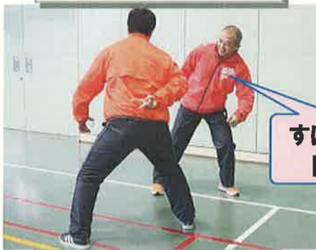
ジャンケン当てゲーム