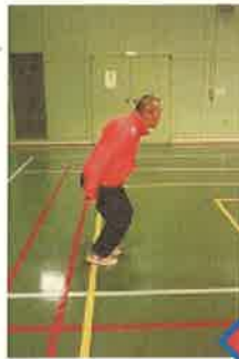
連続両足ジャンプ