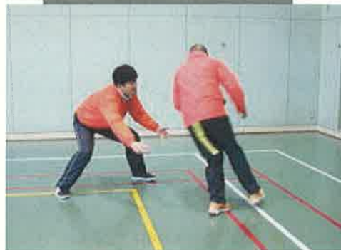
しっぽとりゲーム

宝取りおに タグラグビー フラッグフットボール ねことねずみ 手つなぎおに ジグザグタッチ