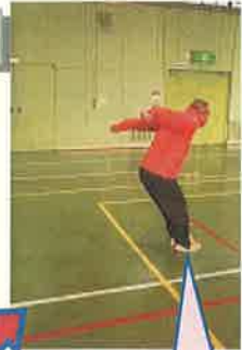
リズムよくジャンプ!