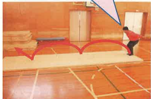
連続両足ジャンプ