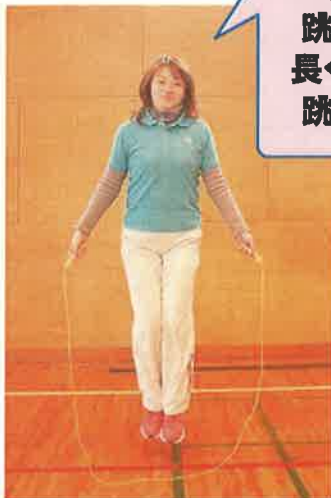
短縄跳び 長縄8の字跳び