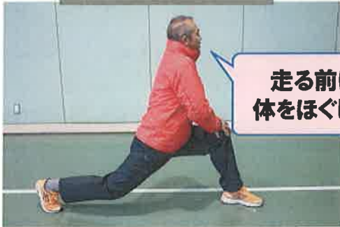
股関節ストレッチ