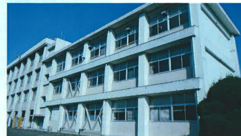
徳島県立池田支援学校美馬分校