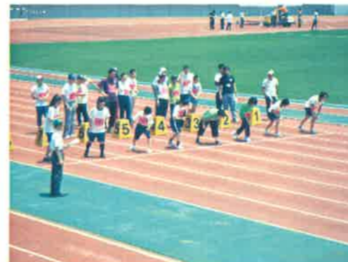
ノーマピックススポーツ大会

★ 基礎的な知識・技能を高めるため、国語・数学・音楽・保健体育・美術・職業・家庭科・自立活動等に取り組んでいます。