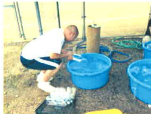
授業風景(作業学習)